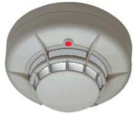
Detector Termovelocimétrico/Térmico Convencional Mod.ECO1005 A / ECO1005T A / ECO1004T A

Las bases compatibles incorporan una lengüeta de continuidad para mantener la línea de detección activa en caso de extracción del equipo con resorte de rearme en caso de volver a instalar un detector. Las pruebas de activación del equipo (Test) se realizan mediante un pulsador de rayo láser codificado.