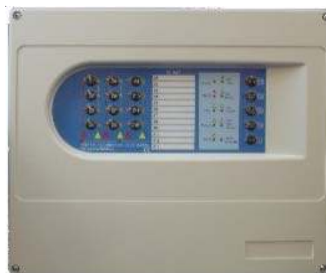
VSN LT Central convencional, modelo de 2-4-8-12 zonas.