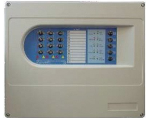
VSN LT Central convencional, modelo de 2-4-8-12 zonas.

Las centrales Vision incluyen una configuración por defecto, apta para cualquier instalación no obstante la personalización puede realizarse fácilmente. La central dispone de salida de 24V para pequeños consumos de tensión fija o rearmable. Adicionalmente, es posible la configuración para instalaciones especiales, donde no se requiera el cumplimiento de EN54.