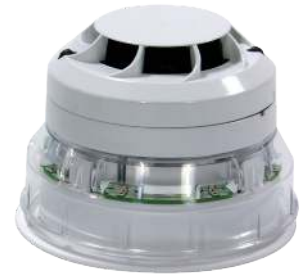
El detector se compra por separado

Nota importante: Para que el producto obtenga la clasificación IP, debe instalar la pieza selladora que se suministra con el equipo.